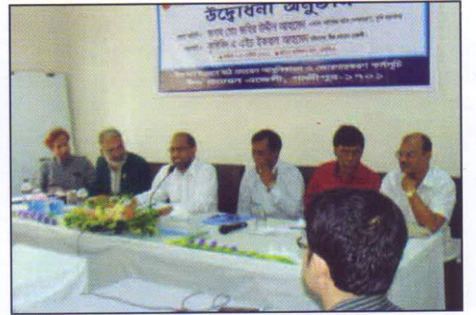
বীজের মান নিয়ন্ত্রণ এবং বীজ আইন ও বিধি শীর্ষক প্রশিক্ষণ কার্যক্রম