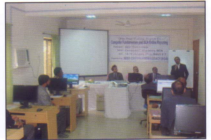
আইসিটি বিষয়ক প্রশিক্ষণ কার্যক্রম