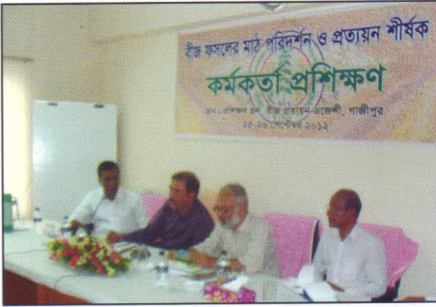
বীজ ফসলের মাঠ পরিদর্শন ও প্রত্যয়ন শীর্ষক প্রশিক্ষণ কার্যক্রম।