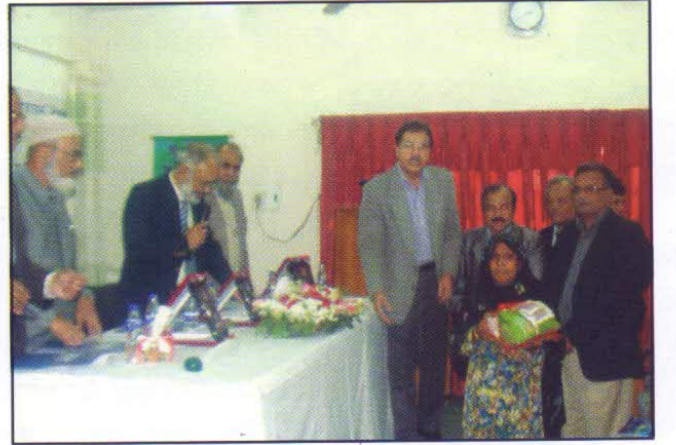
কৃষকদের মাঝে মানসম্পন্ন বীজ বিতরণ কার্যক্রম, ২০১৩