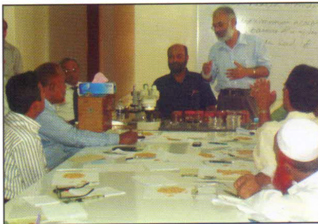
বীজ পরীক্ষণ শীর্ষক প্রশিক্ষণ কার্যক্রম