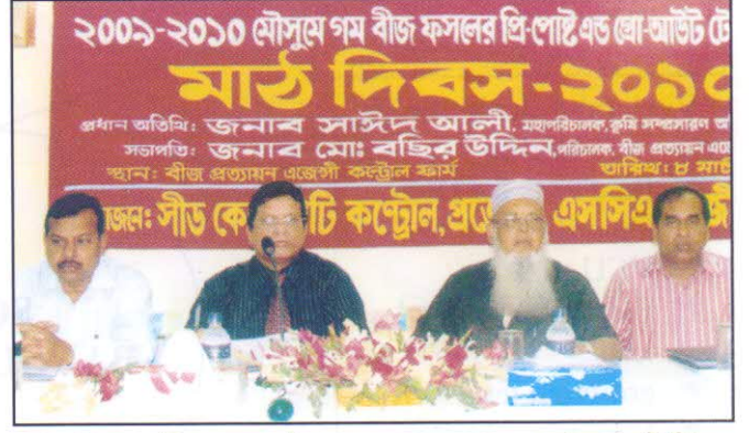
মাঠ দিবস উপলক্ষে উন্মুক্ত আলোচনায় প্রধান অতিথিসহ সভাপতি মহোদয়।