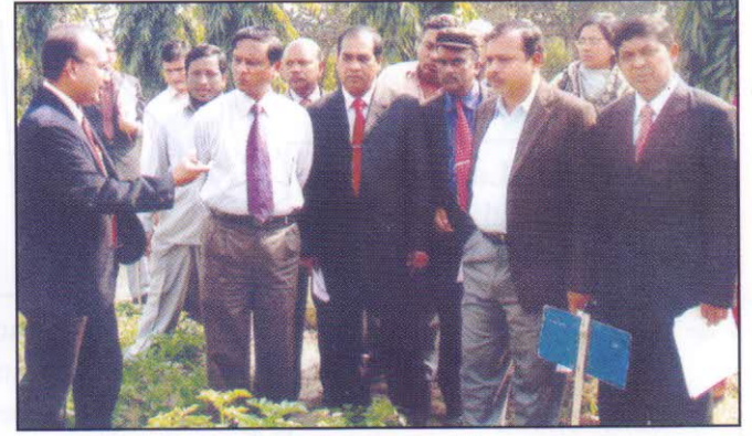
এস সি এ ক্যাম্পাস পরিদর্শন করছেন সচিব মহোদয়।