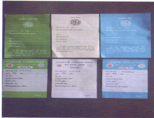
বীজ প্রত্যয়ন এজেন্সি কর্তৃক প্রদত্ত পুরাতন ও নতুন প্রত্যয়ন ট্যাগ