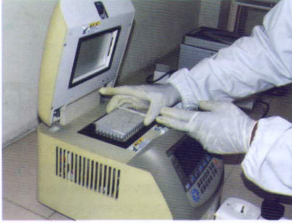
জাত পরীক্ষাগারে ডিএনএ ফিঙ্গার প্রিন্টিং কার্যক্রম