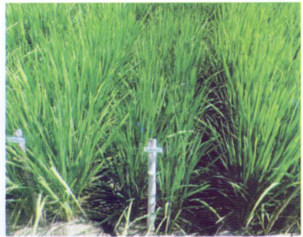
আউশ ধানের ডিইউএস টেস্ট