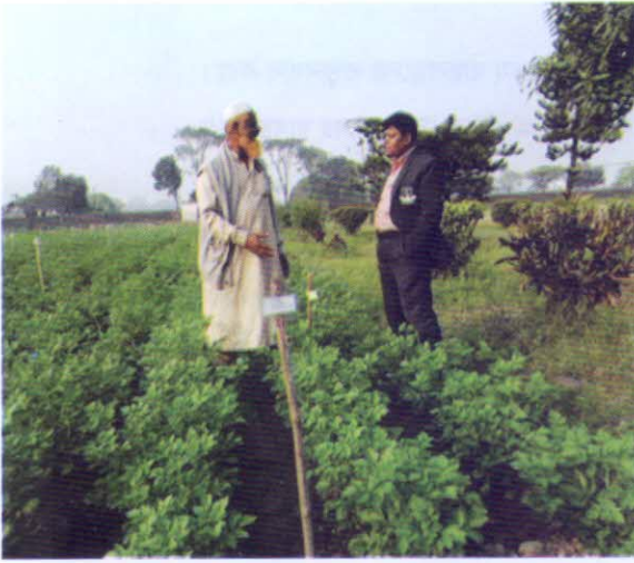
আলুর গ্লো-আউট টেস্ট