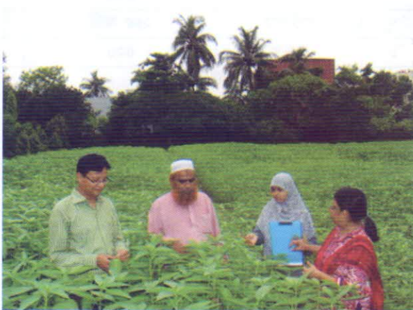
অতিরিক্ত পরিচালক, বীজ প্রত্যয়ন এজেন্সি কর্তৃক পাট ফসলের ঘো-আউট টেস্ট প্রদর্শন