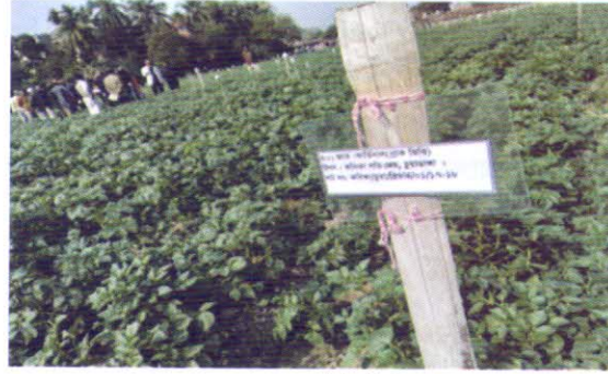
আলুর শো-আউট টেস্ট