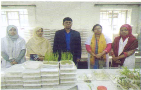
বীজের অংকুরোদগম পরীক্ষার প্রস্তুতি চলাকালীন একটি মুহূর্তের রেকর্ড