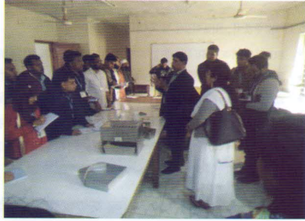
বিশ্ববিদ্যালয়ের কৃষি অধ্যয়নরত ছাত্রছাত্রীদের বীজ নমুনা নিবন্ধন ও বীজের বিশুদ্ধতা পরীক্ষা সম্পর্কে ধারণা প্রদান করছেন মুখ্য বীজ প্রযুক্তিবিদ