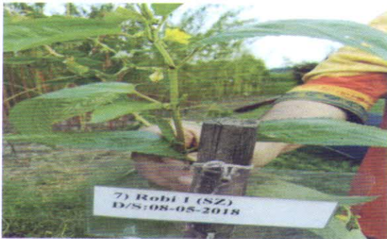
পাট ফসলের শো-আউট টেস্ট