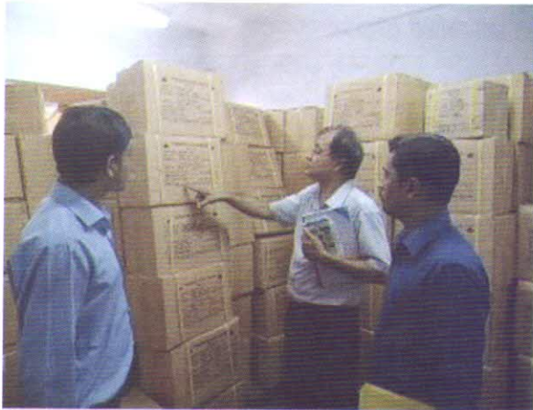
কৃষি মন্ত্রণালয়ের মাধ্যমে নিয়োগ প্রাপ্ত সিএ ফার্ম কর্তৃক ট্যাগের গুদাম পরিদর্শন