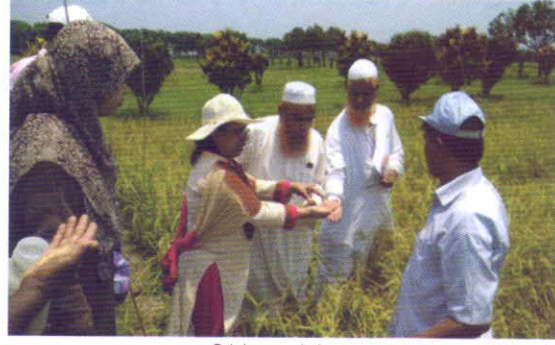
আমন ধানের ডিইউএস টেস্ট এর তথ্য সংগ্রহ