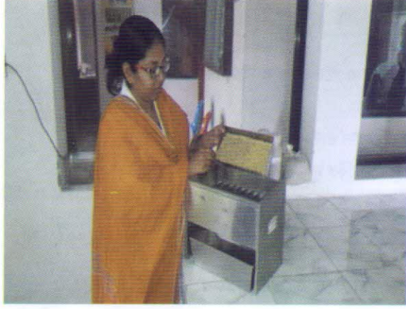
কেন্দ্রীয় বীজ পরীক্ষাগারে ওয়াকিং নমুনা প্রস্তুতকরণ