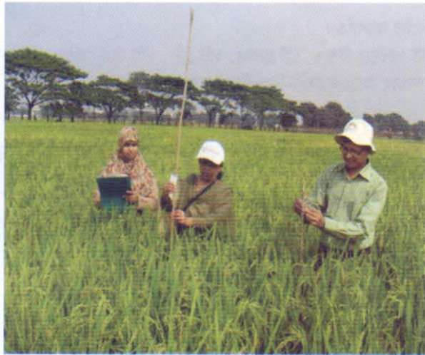
আমন ধানের ডিইউএস টেস্ট এর তথ্য সংগ্রহ