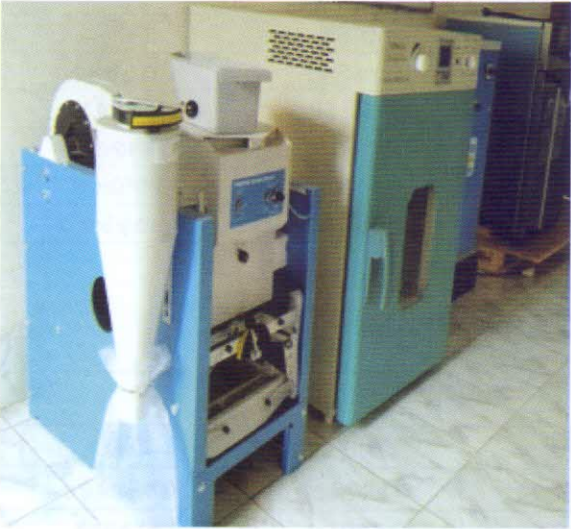
বীজ স্ক্রিনিং মেশিন