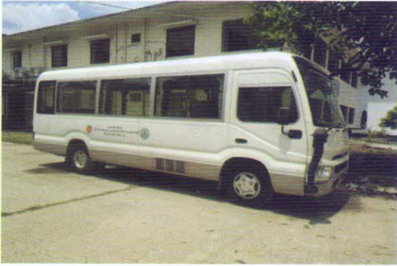
ভ্রাম্যমাণ বীজ পরীক্ষার মোবাইল ভ্যান