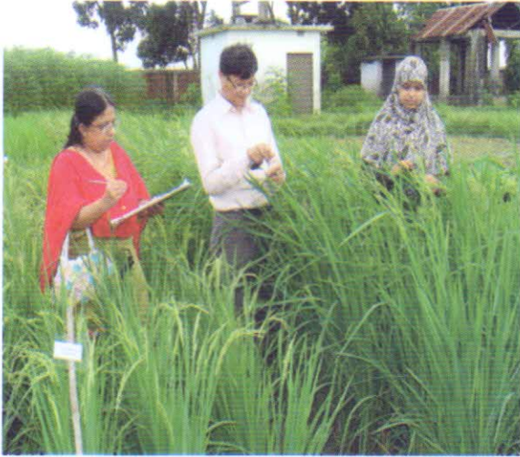
বোরো ধানের ডিইউএস টেস্ট এর তথ্য সংগ্রহ