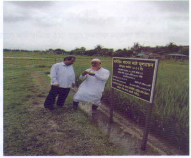
হাইব্রিড ধানের মাঠ পরিদর্শন