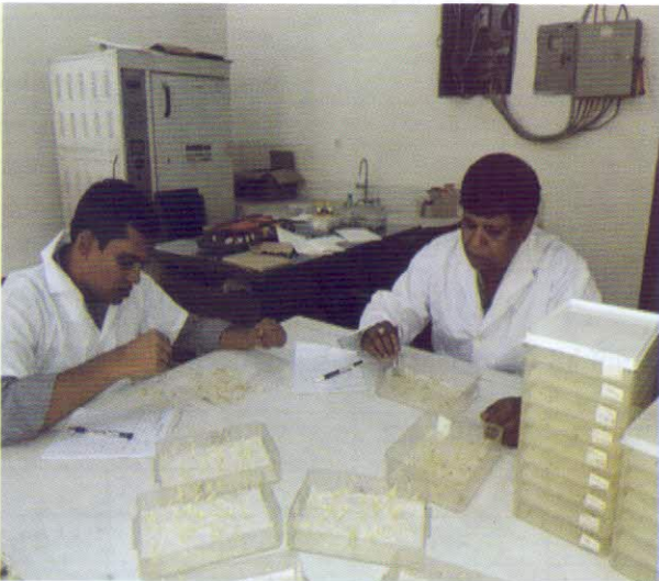
প্রধান বীজ প্রযুক্তিবিদ বীজ রোগতত্ত্ববিদ এর কার্যক্রম তত্ত্বাবধান করছেন