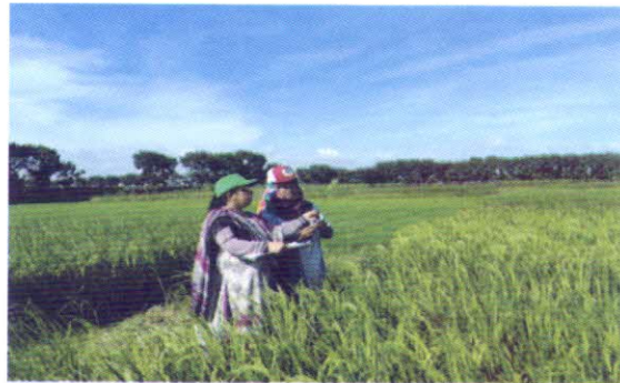
আউশ ধানের শো-আউট টেস্টের তথ্য সংগ্রহ