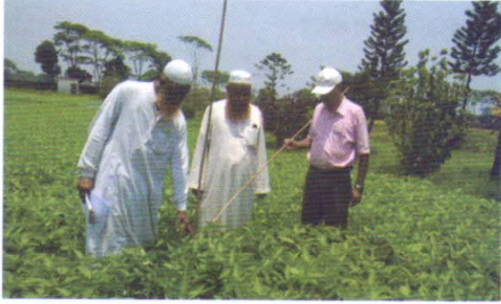
অতিরিক্ত পরিচালক, বীজ প্রত্যয়ন এজেন্সি কর্তৃক পাট ফসলের ডিইউএস প্লট পরিদর্শন