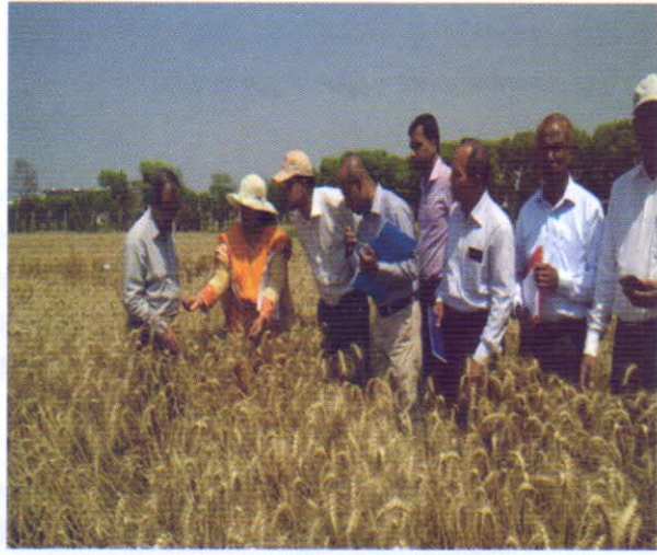
গমের মাঠ দিবস অনুষ্ঠানে সরকারি-বেসরকারি প্রতিষ্ঠানের প্রতিনিধিগণের অংশগ্রহণ