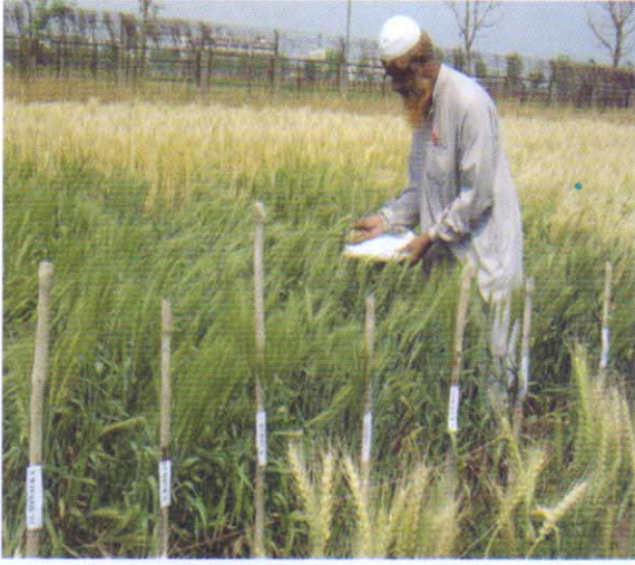
গমের ডিইউএস টেস্ট