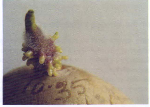
আলুর স্প্রাউট টেস্ট