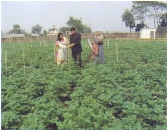
আলুর ঘো আউট টেস্ট এর তথ্য সংগ্রহ