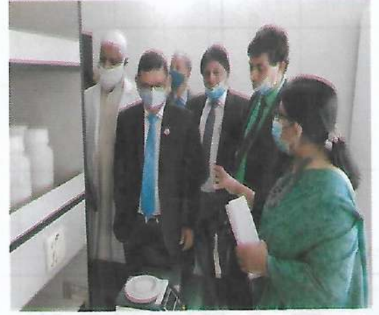
সচিব, কৃষি মন্ত্রণালয় ও পরিচালক, বীজ প্রত্যয়ন এজেন্সী কর্তৃক কেন্দ্রীয় বীজ পরীক্ষাগার পরিদর্শন