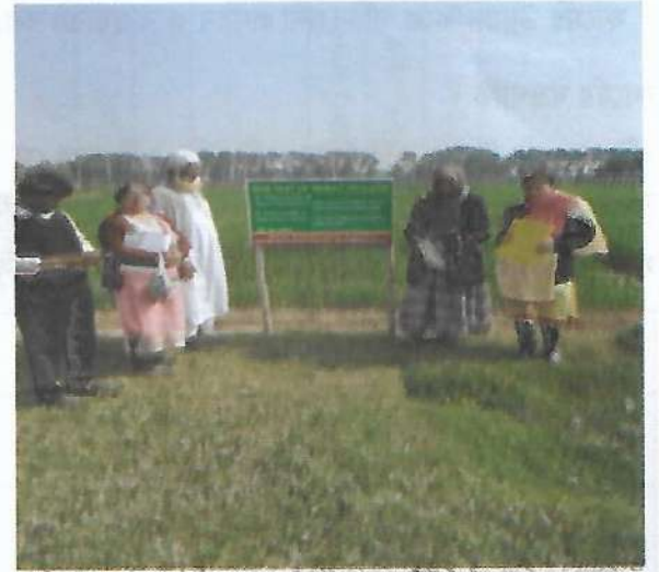
গমের ডিইউএস পুট পরিদর্শন