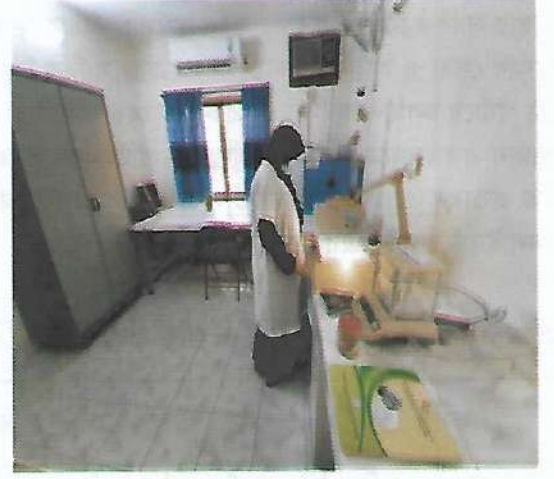
বীজের বিশুদ্ধতা পরীক্ষাকরণ