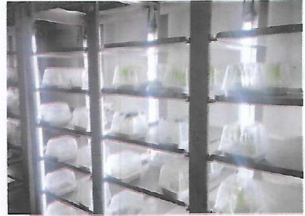
আলুর গ্রো-আউট টেস্ট