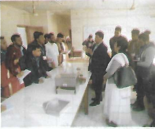
বিশ্ববিদ্যালয়ের শিক্ষার্থী কর্তৃক কেন্দ্রীয় বীজ পরীক্ষাগার পরিদর্শন