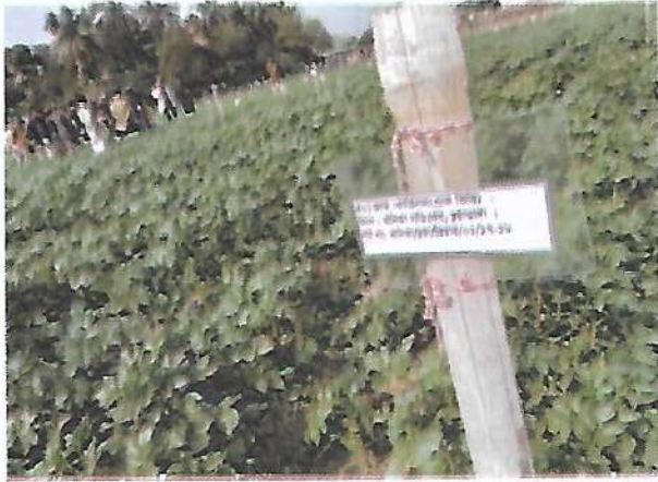
গম ফসলের ত্রুপ মিউজিয়াম