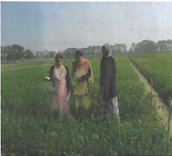
গমের ডিইউএস টেস্টের তথ্য সংগ্রহ