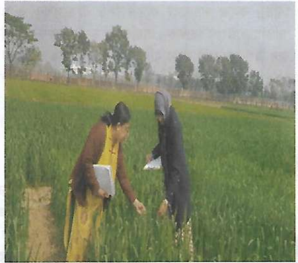
গমের ধো আউট টেস্ট