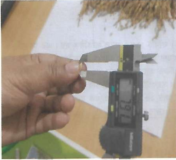
আউশ ধানের ডিইউএস টেস্ট কার্যক্রমের আওতায় শস্য দানার তথ্য সংগ্রহ