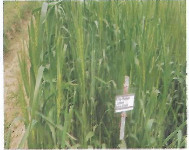
গম ফসলের ধানের ডিইউএস টেস্ট এর তথ্য সংগ্রহ