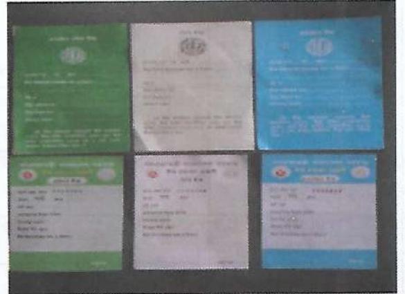
বীজ প্রত্যয়ন এজেন্সী কর্তৃক প্রদত্ত পুরাতন ও নতুন প্রত্যয়ন ট্যাগ