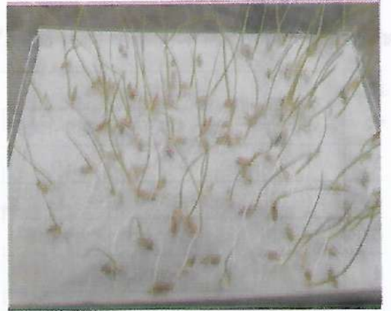
বীজের অঙ্কুরোদগম পরীক্ষাকরণ