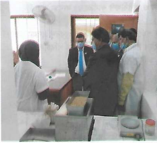
সচিব, কৃষি মন্ত্রণালয় কর্তৃক কেন্দ্রীয় বীজ পরীক্ষাগার পরিদর্শন