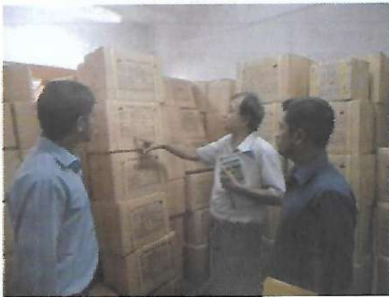
কৃষি মন্ত্রণালয়ের মাধ্যমে নিয়োগ প্রাপ্ত সিএ ফার্ম কর্তৃক ট্যাগের গুদাম পরিদর্শন