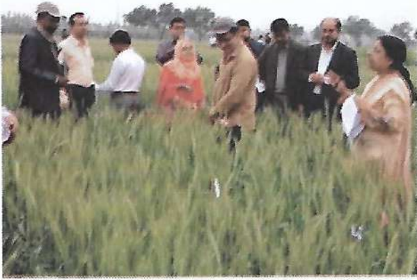
গম ফসলের মাঠ দিবস অনুষ্ঠানে অংশগ্রহণকারী সরকারি-বেসরকারি প্রতিষ্ঠানের প্রতিনিধিগণের সামনে বিভিন্ন কার্যক্রম বিষয়ে তথ্য উপস্থাপন