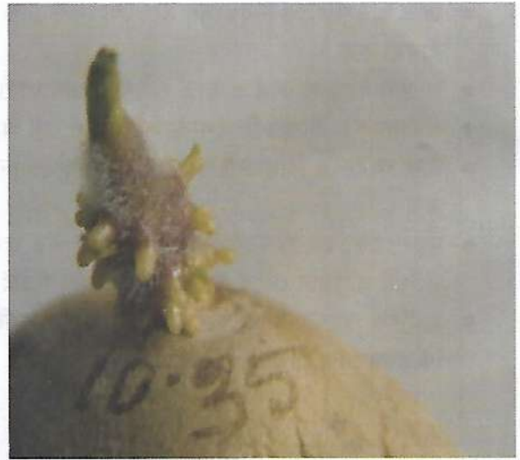
আলুর স্পাউট টেস্ট