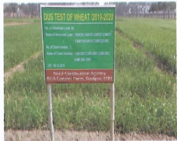
গম ফসলের ডিইউএস টেস্ট প্লট