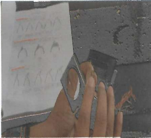
ল্যাব ভিত্তিক গমের ডিইউএস টেস্ট