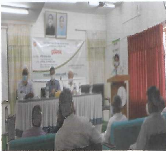
আউশ ধানের গ্রো আউট টেস্ট শীর্ষক সেমিনার