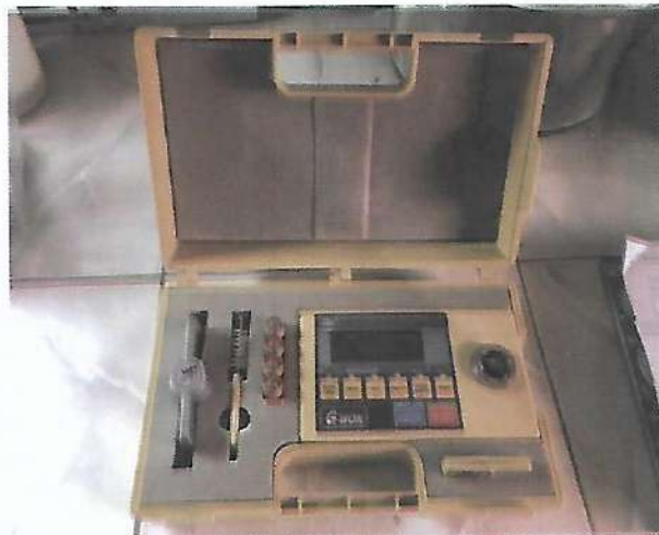
সীড ময়েশচার মিটার