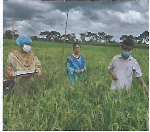
আমান ধানের ধো-আউট টেস্ট