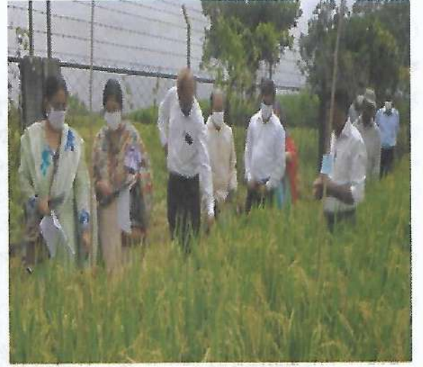
আউশের মাঠ দিবস অনুষ্ঠানে সরকারি-বেসরকারি প্রতিষ্ঠানের প্রতিনিধিগণের অংশগ্রহণ