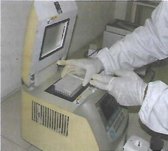
জাত পরীক্ষাগারে ডিএনএ ফিঙ্গার প্রিন্টিং কার্যক্রম