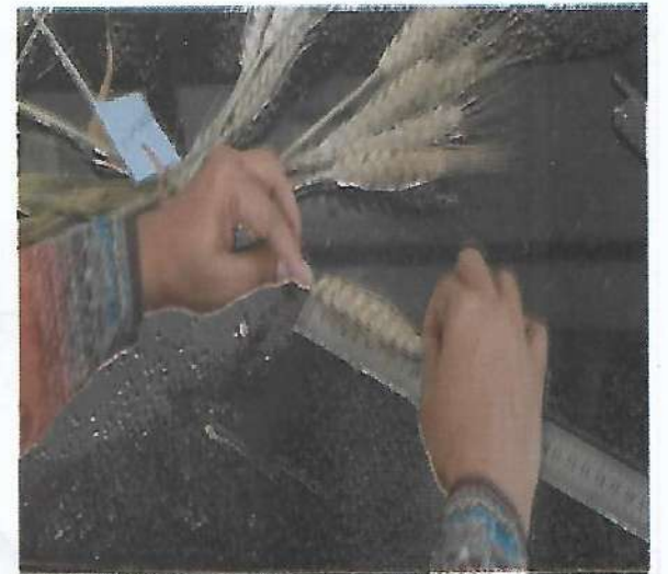
গমের ডিইউএস টেস্ট কার্যক্রমের আওতায় ল্যাব ভিত্তিক তথ্য সংগ্রহ