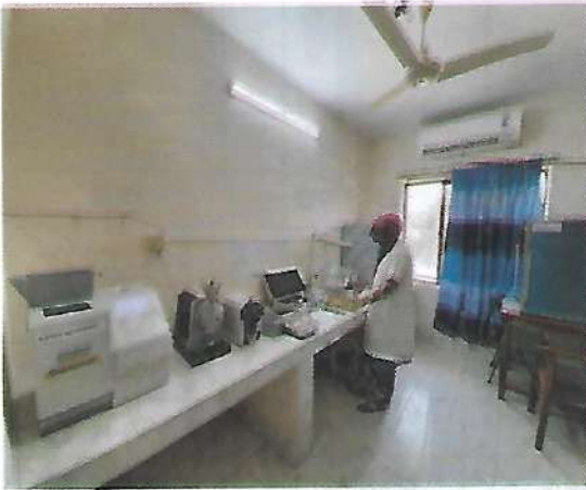
বীজের আদ্রতা পরীক্ষাকরণ