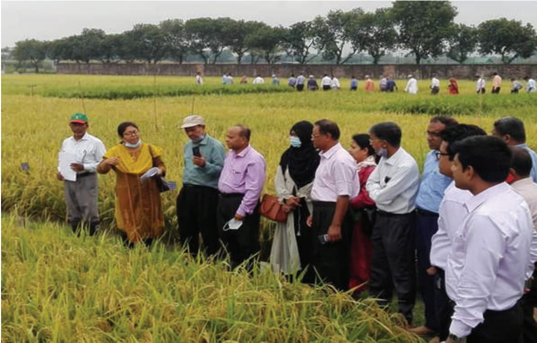
বোরো ধানের মাঠ দিবস অনুষ্ঠানে এসসিএ এবং অন্যান্য প্রতিষ্ঠানের প্রতিনিধিবৃন্দের মাঠ পরিদর্শন