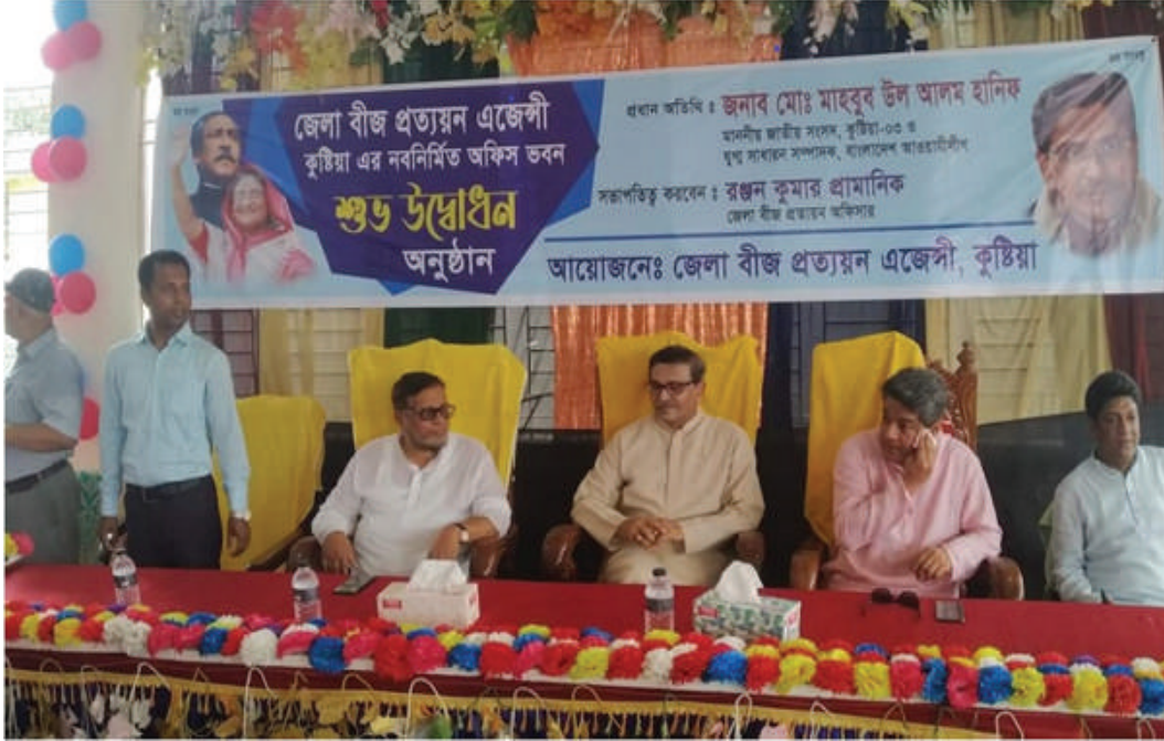
বীজ প্রত্যয়ন এজেন্সী, কুষ্টিয়া এর নবনির্মিত অফিস ভবন উদ্বোধন করেন জনাব মো: মাহবুব-উল-আলম হানিফ, মাননীয় জাতীয় সংসদ সদস্য কুষ্টিয়া-০৩ ও যুগ্ম সাধারণ সম্পাদক, বাংলাদেশ আওয়ামী লীগ