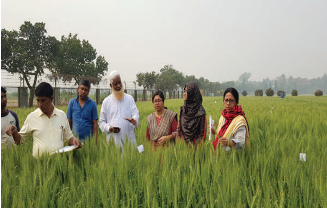
গম বীজের গ্রো-আউট টেস্টের তথ্য সংগ্রহ