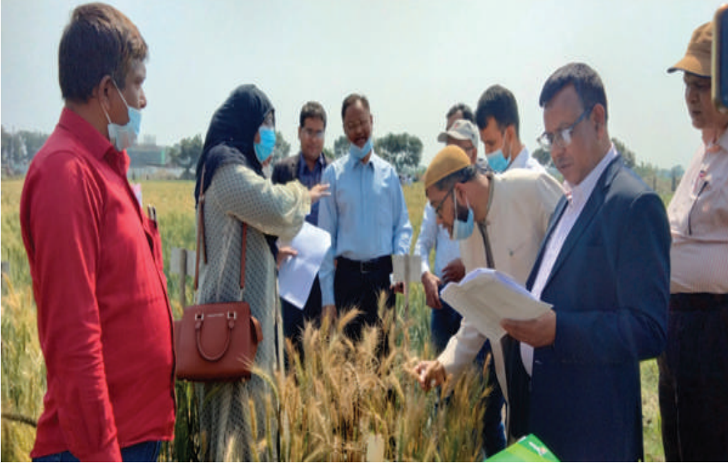
গম ফসলের মাঠ দিবস অনুষ্ঠানে বিভিন্ন প্রতিষ্ঠানের প্রতিনিধিবৃন্দের অংশগ্রহণ