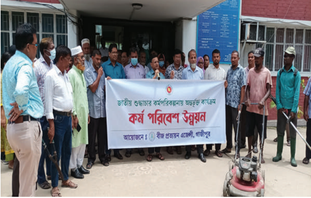
জাতীয় শুদ্ধাচার কর্মপরিকল্পনায় 'অন্তর্ভুক্ত কার্যক্রম কর্ম পরিবেশ উন্নয়ন'