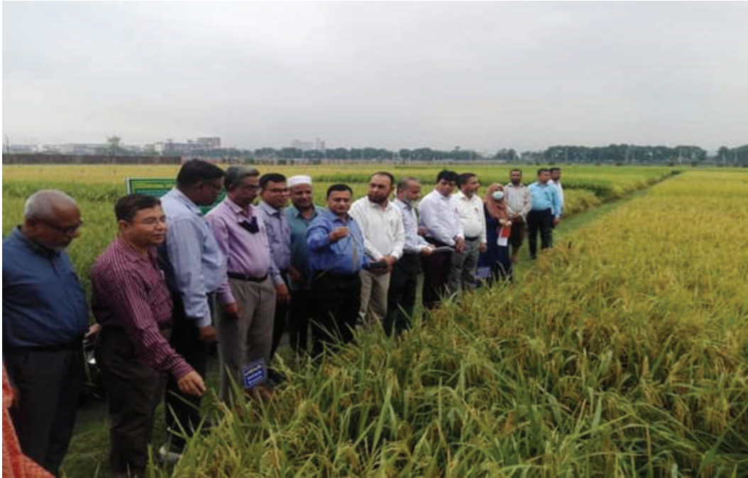
বীজ প্রত্যয়ন এজেন্সীর পরিচালক মহোদয় ও অন্যান্য প্রতিষ্ঠানের প্রতিনিধিবৃন্দের ধান ফসলের মাঠ পরিদর্শন